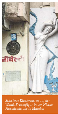
Stillierte Klaviertasten auf der Wand, Frauenfigur in der Nische: Fassadendetails in Mumbai

er auch in Schulen: Die Klassen gehen als „Déco-Detektive“ durch die Millionenmetropole und suchen versteckte Architekturschätze. Drei weitere haben sie schon gefunden.