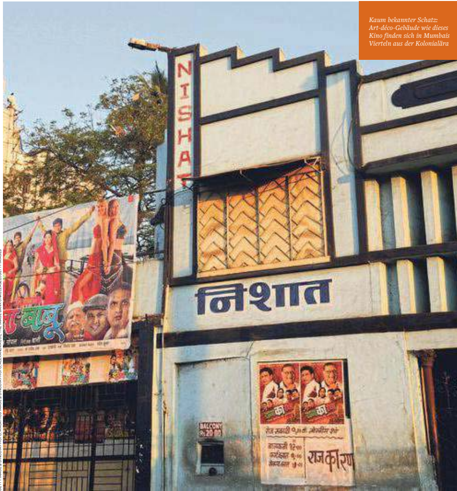
Kaum bekannter Schatz: Art-déco-Gebäude wie dieses Kino finden sich in Mumbais Vierteln aus der Kolonialära