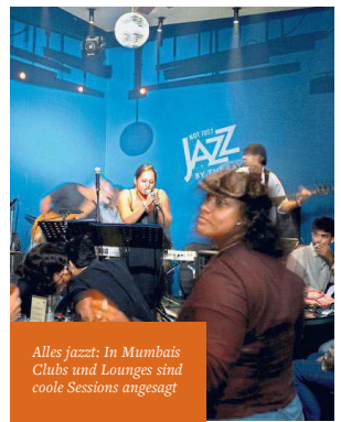
Alles jazzt: In Mumbais Clubs und Lounges sind coole Sessions angesagt