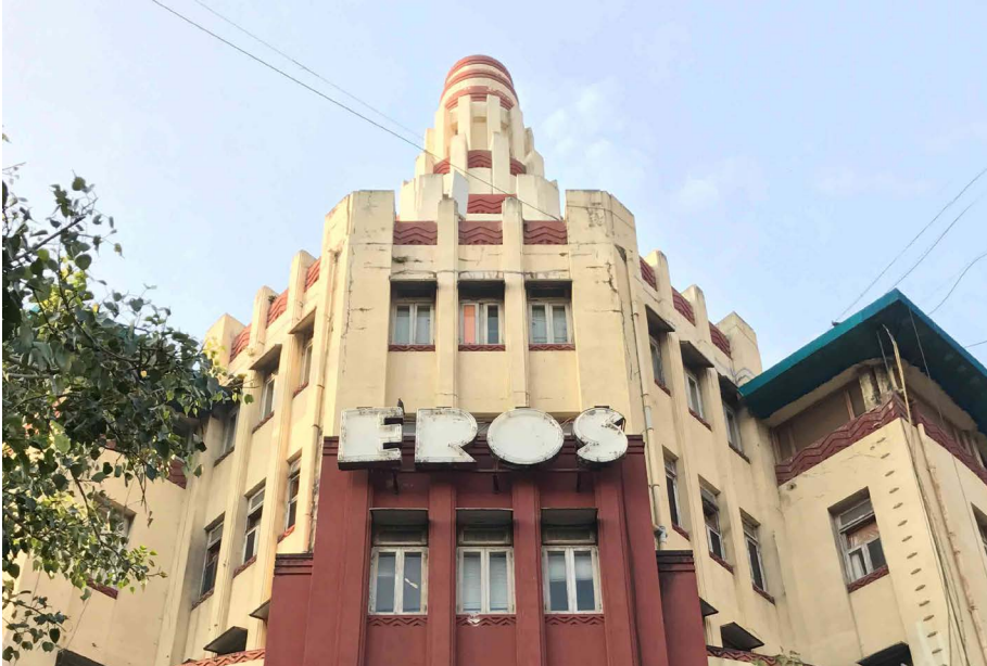
Eros Cinema, Churchgate

In 1947, the year of Indian independence, to be precise. It was the same time that Mumbai's elite lifestyle became fashionable. Enthusiasm for films drew people to the new Art Deco film palaces such as the Regal Cinema in Colaba, Mumbai's very first Art Deco building, or the imposing Eros Cinema in Churchgate: the building resembles a wedding cake because it rises in levels and is crowned with a tower. Or the Liberty Cinema in Marine Lines. Cinema films are still shown at the Regal and at the Liberty; a visit is definitely worthwhile.