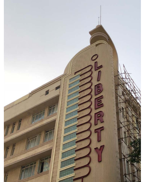
Liberty Cinema, Marine Lines